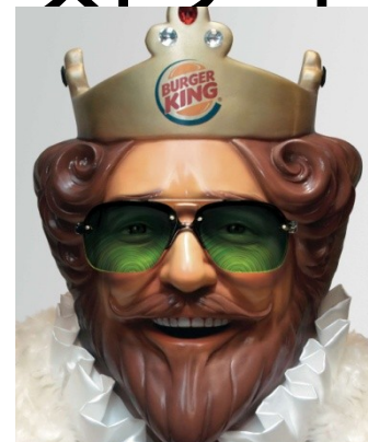
マスコットキャラクター バーガーキング氏