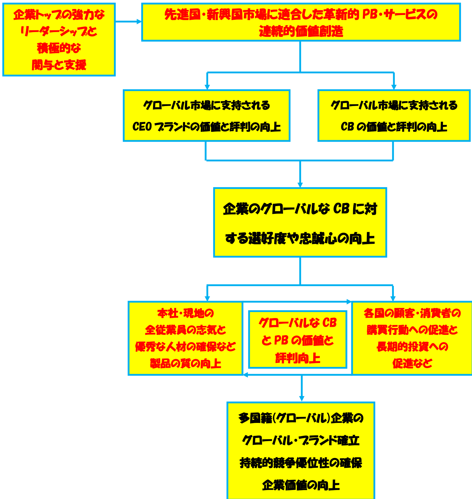
図4 グローバル・ブランド確立プロセス

注:PB(Product Brand), CB(Corporate Brand)