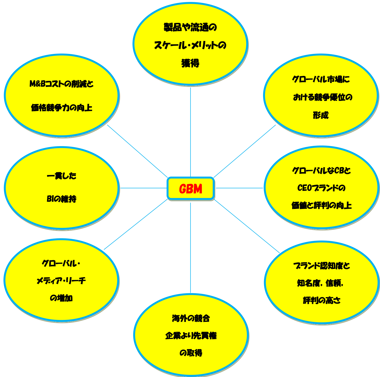
図3 グローバル・ブランド確立におけるメリット

注:M(Marketing), B(Branding), BI(Brand Identity), CB(Corporate Brand),