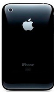
iPhone 3G/5 2008/2009