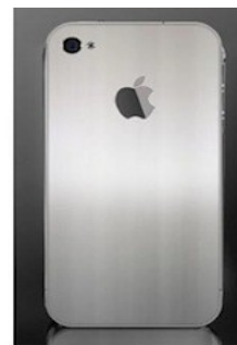
iPhone 5 2011