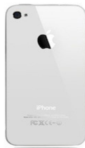
iPhone 4 2010